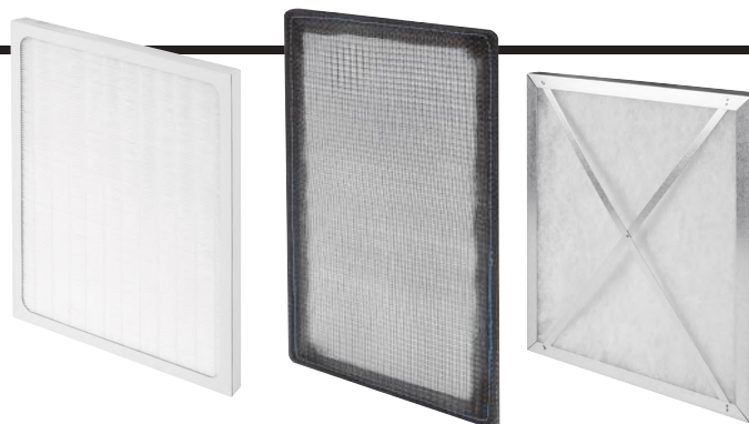
AUROS / AVIRA / AQUILA

W przypadku filtra wstępnego, którego materiałem filtracyjnym jest siatka nylonowa, nie ma potrzeby jego wymiany. Zastosowany materiał umożliwia jego wielokrotne czyszczenie.